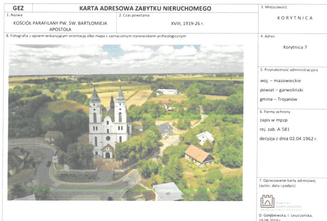
Rysunek 1 Przykładowa karta GEZ - awers