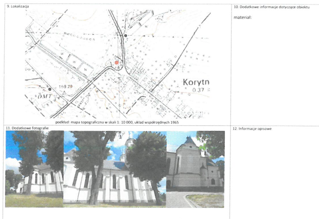
Rysunek 2 Przykładowa karta GEZ - rewers